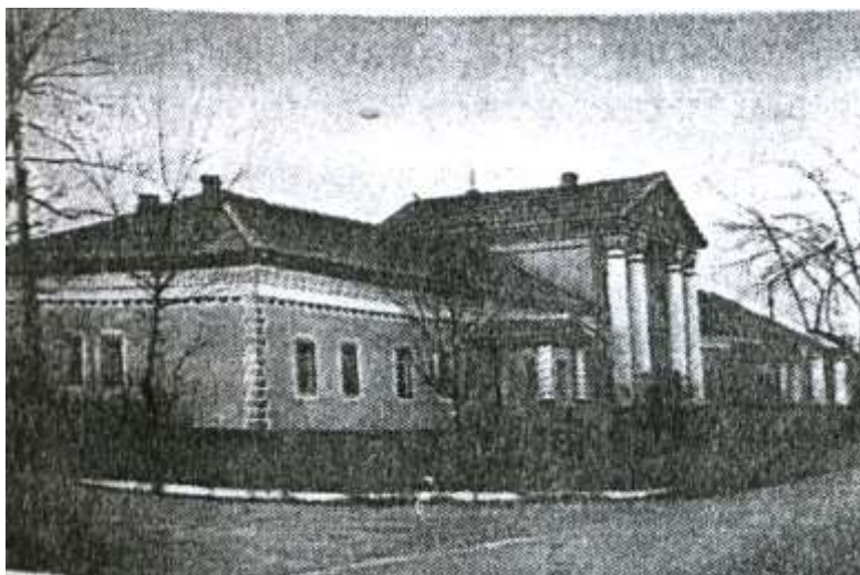
Жилой корпус с мезонином