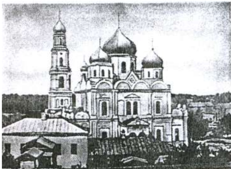
Церковь Богородицы Троеручицы. Фото кон. 19 века